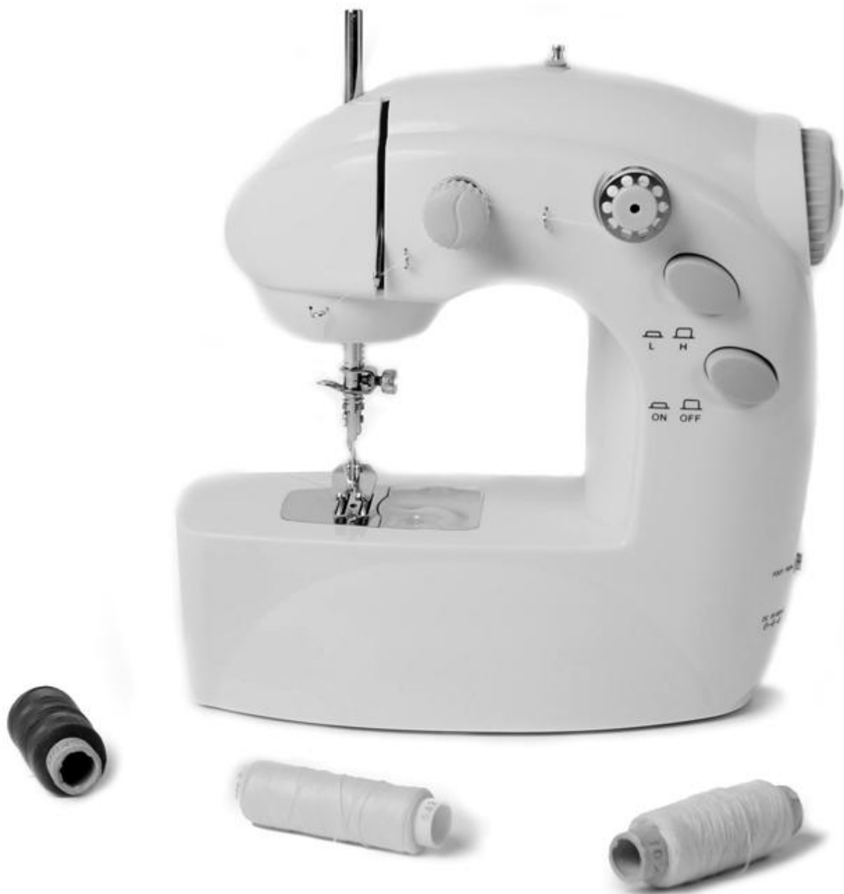
Мини швейная машинка Инструкция по эксплуатации