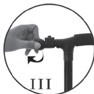
III — Закройте крышку