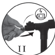
II — Надлежащим образом установите четыре батарейки LR44