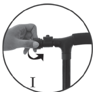
I — Откройте крышку