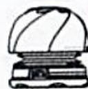
Открытое положение колонки